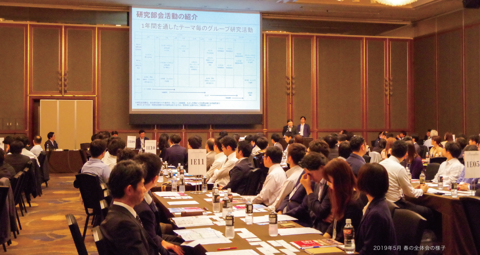
2019年5月 春の全体会の様子