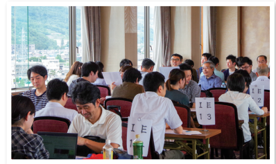
2019年7月 東日本合同合宿の様子